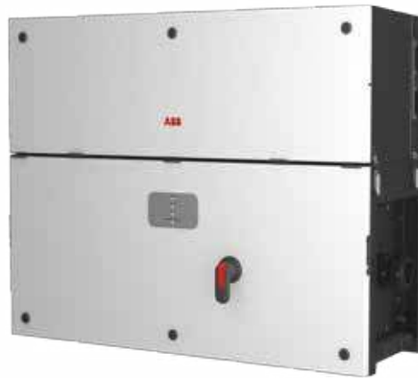
ABB String-Wechselrichter PVS-100/120-TL 100 bis 120 kW